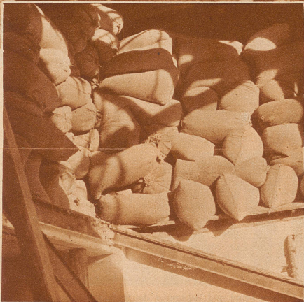
100 000 kg Mais und Gerste, 10 Eisenbahnwagen voll, lagerten auf dem Dachboden. Die Eisenträger der Decke bogen sich unter der Last, verloren den Halt auf den Stützmauern und – das Unglück war geschehen

In St. Margrethen (St. Galler Rheintal) ereignete sich am letzten Donnerstag eine fürchterliche Katastrophe. In einem Gebäude der Kühlhaus A.-G., in welchem über 60 Personen mit Schlachten und Rupfen von Geflügel beschäftigt waren, stürzte infolge Überbelastung des Dachbodens durch eingelagerte Futtermittel die Decke ein und begrub über 30 Personen unter den Trümmern. 9 Personen, darunter eine Mutter von 10 Kindern und eine von 5 Kindern, erstickten unter den Säcken und offenen Futtermitteln. 20 Personen erlitten schwere und leichtere Verletzungen