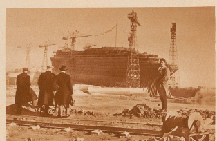
Die «Normandie» noch in der Werft, umgeben von den Riesekränen, unmittelbar vor dem Stapellauf. Ein Jahr im Augusten und lebendigen vor 4 Tage dann beschiffte. Das nicht unempfindliche Stapellauf dieser enormen Last vorzubereiten. Zu dem Gerüst, das für den Stapellauf gebaut werden mußte, wurden 2200 Kubikmeter Holz verwendet.

Sonntag, den 29. Oktober, bei der Werft von St. Nazaire, im Besitz des Präsidenten der Republik und über 100 000 Besuchern, die «Normandie», das größte Schiff der Welt, von Stapel. Die Patrone hat die Frau des Präsidenten übernommen. Die Bauzeit für die Riesenschiff betrug 3 Jahre, seine Kosten belaufen sich auf rund 1 Milliarde Francs, das heißt etwa 200 Millionen Schweizerfranken. Die «Normandie» gehört der «Compagnie Générale Transatlantique» und wird auf der Linie Le Havre—New York in den Dienst gestellt werden.