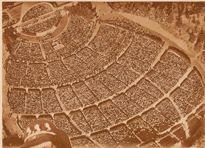
80 000 Menschen an einer demokratischen Wahlversammlung in Hollywood — gute Chancen für Roosevelt! Trotz seines körperlichen Gebrechens — er ist seit einer Jagd in beiden Beinen gelähmt — hat der Kandidat des Demokraten, Franklin Roosevelt, gute Chancen auf die Präsidentschaft; denn Amerika hängt sich immer in rauschender Liebe an den großen Präsidenten Theodor Roosevelt, an «Teddy». «Jeder Amerikaner», sagen die amerikanischen Zeitungen, «wählt den Namen Roosevelt lieber als irgendeinen andern».