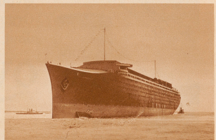
Die «Normandie» eine halbe Stunde nach dem Stapellauf. Allen an diesem Schiff geht ins Riesenschiff. Es ist 314 m lang, 36 m breit und verdrängt 73 000 Tonnen. Seine Maschinen leisten 160 000 PS und ermöglichen eine Geschwindigkeit von 55 km in der Stunde. Die «Normandie» wiegt 21, mal so viel wie der Edleherbe, das Schwermetall ist größer als der Arc de Triomphe in Paris. Die für den Bau des Schiffes verwendeten 11 Millionen Nieten würden, nebeneinander gelegt, eine Linie von 600 km Länge ergeben. Das Schiff hat eine Besatzung von 800 Mann und kann 2170 Passagiere an Bord nehmen.