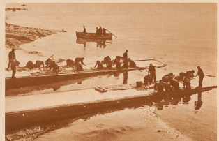
Da ist die Glühbirne aus Eisenbahn, auf der die «Normandie» ins Meer rennt. Mit einer Geschwindigkeit von 5,5 m in der Sekunde gleitet der Riesenkörper, durch die Eingangswehr in Bewegung gesetzt, ins Wasser. Damit ist ein Stapellauf ohne Zwischenfälle vor sich gelaufen, während die Gleitbahnen ganz gehörig eingetrennt werden. Hier wurden 46 600 kg Talg und Seife zum Preise von 150 000 Franken in den Zweck verwendet.