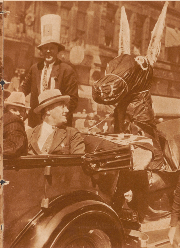
Politischer Triumphzug durch die Straßen von Kansas. Seit überhört in der End der — laienmäßig ironisch gemeint — Symbol des demokratischen Partei, deren Kandidat Roosevelt ist. Hier begrüßt ihn die politische Wappentier bei einer Fahrt durch die Straßen von Kansas. Für entsprechende Begriffe wäre ein solcher Aufzug eine wichtige politische Periodik nicht unvorstellbar — die Amerikaner aber reagieren mit Begeisterung auf diese lustigen Darbietungen.