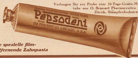
Die spezielle film-entfernende Zahnpasta

Verlangen Sie zur Probe eine 10-Tage-Gratis-Mustertube von O. Brassart Pharmaceutica A.-G., Zürich, Stämpfenbadstraße 75.