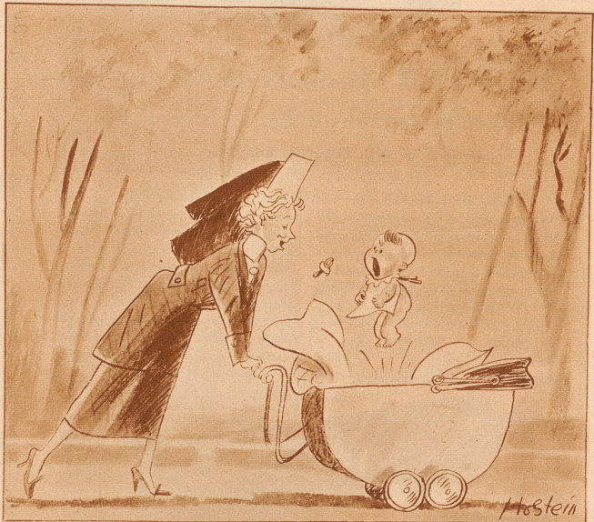
Das moderne Baby: «Hör mal auf mit dem ewigen «Schlaf Kindchen, schlaf...» singe lieber «Das gib's nur einmal» oder laß mich wirklich schlafen!»

«Papa, das ist nicht Faulheit, das ist Klassenhaß!»