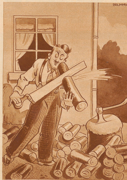
Die Macht der Gewohnheit. Der Violinspieler sägt Holz für den Winter.

«Oh, ich verstehe, wir nennen ihn Schiller.»