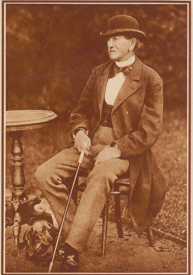
1886: Der 86-jährige Heerführer Graf Moltke in Zivil auf seinem Gut Kreisau. Diese stille, vornehme Aufnahme des alten Militärs ist eine der schönsten von ihm erhaltenen