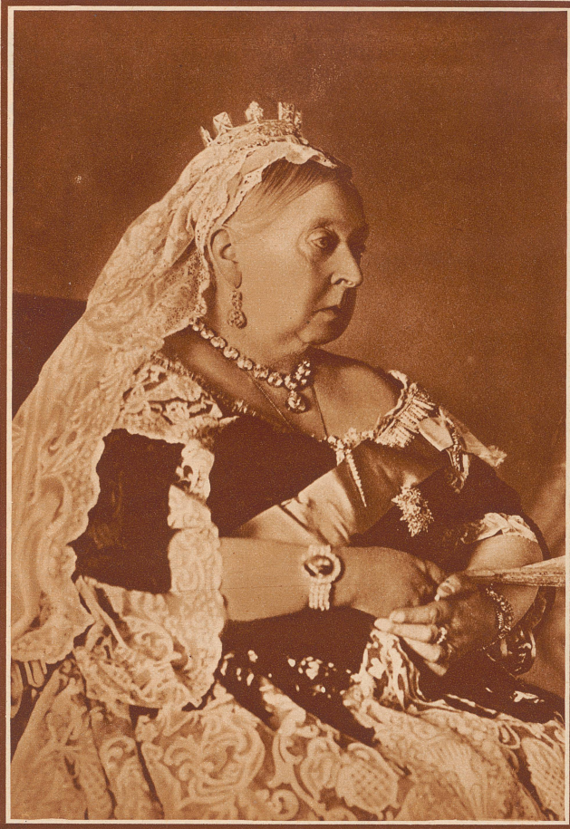
1899: »Her Majesty the Queen« Königin Viktoria von Großbritannien und Irland. Diese legendäre Frau hat den beiden letzten Dritteln des Jahrhunderts den Stempel aufgedrückt. Unter ihrer Regierung (1837–1901) entstand Englands Kap-Kairo-Reich. 18-jährig kam sie auf den Thron, 15 Kriege sah ihre Regierung: den Opiumkrieg gegen China, den Krimkrieg gegen Rußland, den Sepoy-Aufstand in Indien, den zweiten China-Krieg, den abessinischen Feldzug, die Eroberung der Goldküste, die erste Annexion von Transvaal, die Afghanenkriege, die Zulukriege, die Okkupation Aegyptens, den Mahdisten-Aufstand, den ersten und zweiten Burenkrieg, die Eroberung des Sudans und den Boxeraufstand. – Diese Aufnahme der 80-jährigen zeigt als einzige die Queen mit der Krone