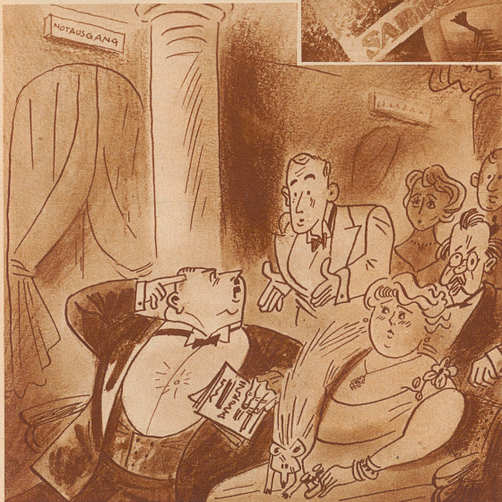
Theater. «Entschuldigung, aber ich verstehe kein Wort . . . .» «Es geht Sie einen Schmarren an, Herr, was ich mit meiner Frau bespreche!»

Der Direktor schritt durch das Geschäft. In einer Ecke saß ein Angestellter und las die Zeitung. Der Chef ging drohend auf ihn zu: