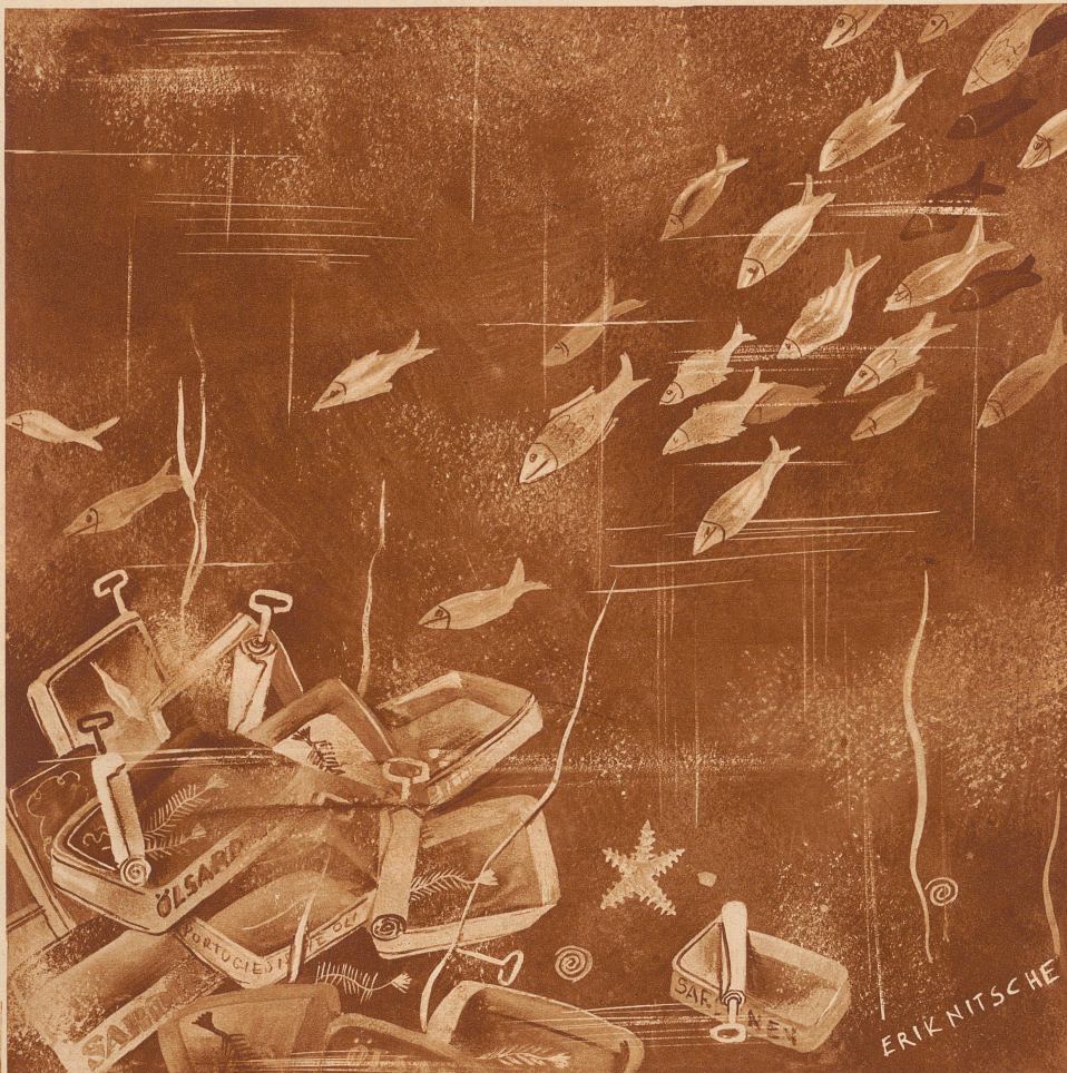
Der Pilgerzug der Sardinen zum Friedhof

Nach einer Minute wieder die Stimme: «Sind Sie noch da? Sie können aufhängen, Ihre Minute ist um.»