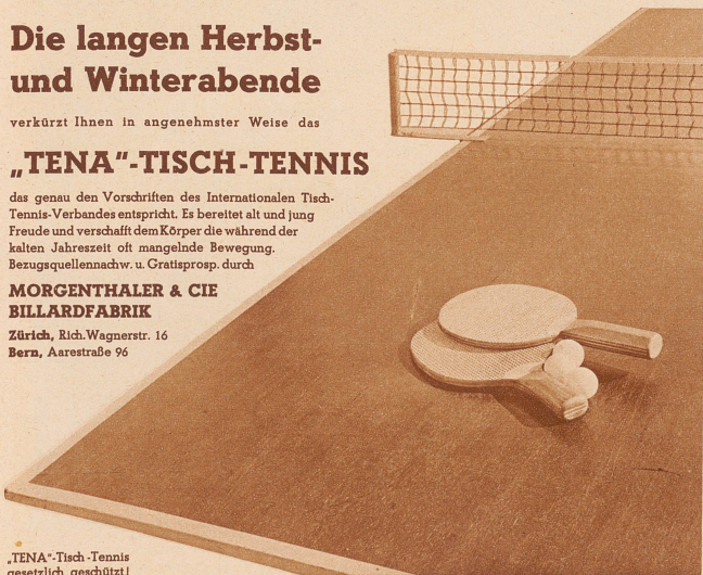
„TENA“-Tisch-Tennis gesetzlich geschützt!

Zürich, Rich. Wagnerstr. 16 Bern, Aarestraße 96