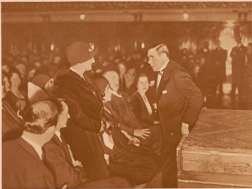
Ein Vortrag Hanussens im Saale der Berliner Philharmonie vor 2500 Menschen:

Der Hellscher beantwortet einer Dame die Frage nach dem Schicksal ihres verschwundenen Sohnes