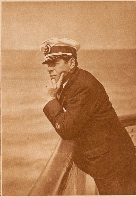
Erik Jan Hanussen an Bord seines Seekreuzers «Ursel VI.»

Der Hellscher beantwortet einer Dame die Frage nach dem Schicksal ihres verschwundenen Sohnes