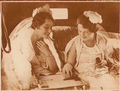
Vor der Präsentation bei Hof: Junge Damen der englischen Aristokratie warten in ihrem Auro vor Buckingham Palace, daß die Reihe an sie kommt, vor dem König den Hofknicks auszuführen. Mit Backgammon-Spiel vertreiben sie sich die vielen Wartestunden