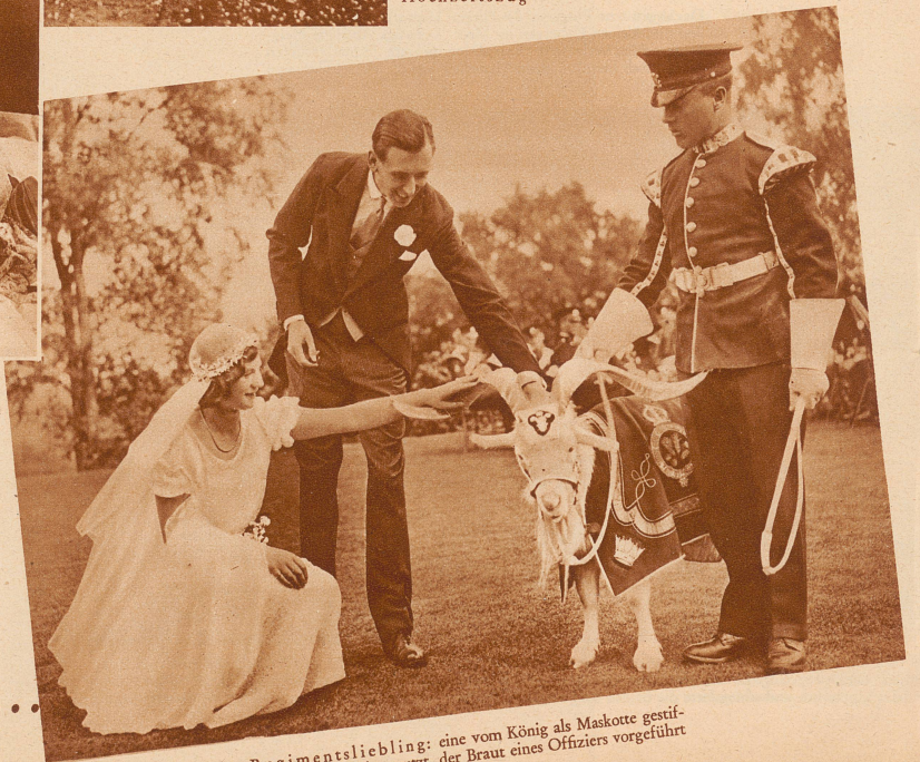
Der Regimentsliebling: eine vom König als Maskotte gestiftete Ziege wird, festlich geputzt, der Braut eines Offiziers vorgeführt