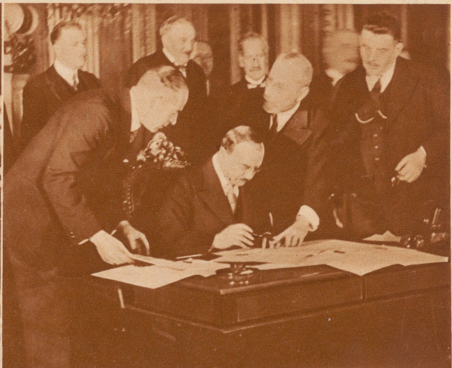
Der russisch-französische Nichtangriffspakt. Dowgalewski, der Sowjetbotschafter in Paris, unterzeichnet den Vertrag, der eines der wichtigsten internationalen Abkommen der letzten Jahre darstellt. Rechts Herriot, der soeben unterzeichnet hat