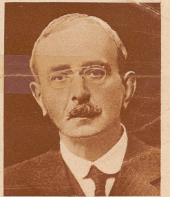
Sir Charles Sherrington

der große englische Dramatiker und Romanschaffsteller, erhielt den Literatur-Nobelpreis in Anerkennung seines literarischen Gesamtwerkes. Sein bekanntestes Werk ist die «Forsyte Saga», eine Familiengeschichte, die ein klassisches Gemälde der sogenannten «obern Mittelklassen» Englands aus der Zeit der Königin Viktoria und Eduards VII. gibt