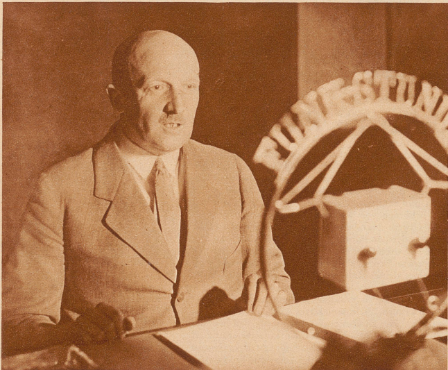
Der neue deutsche Reichskanzler. General Kurt von Schleicher ist vom Reichspräsidenten an Stelle Papens zum Reichskanzler ernannt worden und hat ein neues Kabinett zusammengestellt. General Schleicher, «der Mann mit der märchenhaften Karriere», steht im 50. Altersjahr. Neben dem Reichskanzleramt wird er den Posten des Reichswehrministers beibehalten