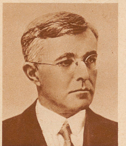
Prof. Irwing Langmuir

von der Universität Oxford, teilt sich mit Professor Douglas Adrian aus Cambridge in den Preis für Medizin. Die beiden erhalten den Preis in Anerkennung ihrer langjährigen erfolgreichen Arbeiten und Forschungen über die Funktionen der Nervenzellen. Sherrington steht im 74. Lebensjahr und gehört zu den bedeutendsten Physiologen der Gegenwart