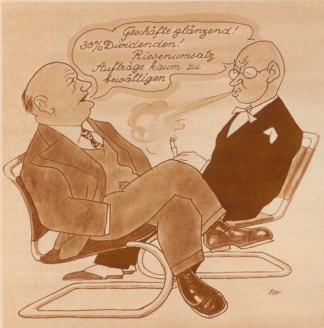
Herr Großmaul bei einem Bekannten . . . .