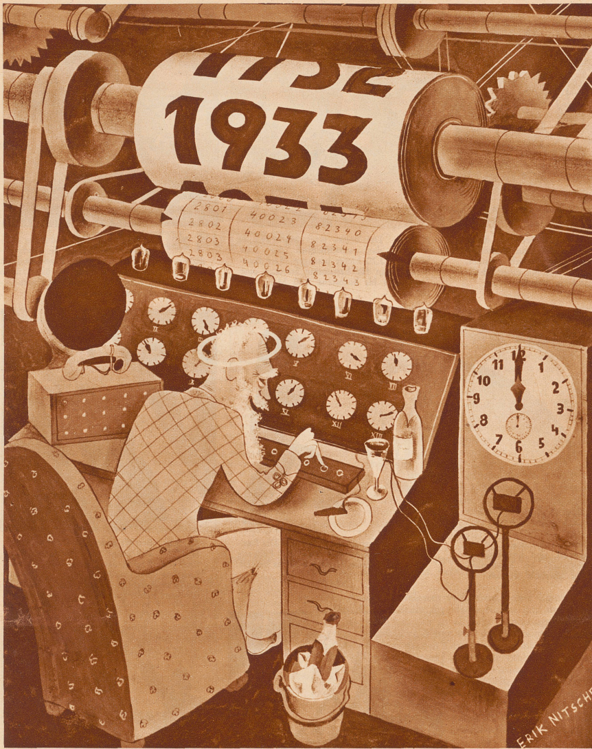
Der große Moment