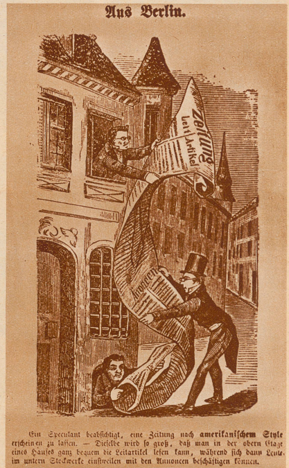
Ein Exzentrik beauftragt, eine Zeitung nach amerikanischem System zu liefern. - Die Rolle wird so groß, daß man in der oberen Etage eines Hauses ganz bequem die Leitartikel lesen kann, während sich dann Leute im unteren Stockwerk eifriger mit den Annoncen beschäftigen können.

Die große moderne Tageszeitung. Diese Karikatur aus dem Jahre 1867 ist für das rasche Wachstum der freien Presse kennzeichnend. Die ersten Riesenauflagen und die ersten Großformate sind entstanden