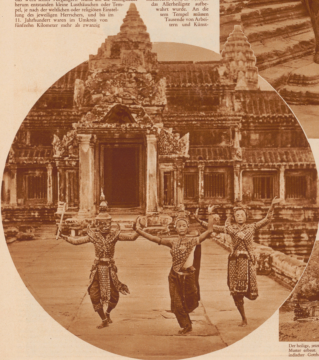
Links: Tanzepisode im Tempel von Angkor-Wat. In den farbigen Kostümen aus vergangener Zeit, mit graziösen Hand- und Fußbewegungen, tanzen die Kambodschaner-Frauen im wiedererstandenen Tempel Episoden aus der alten Mythologie