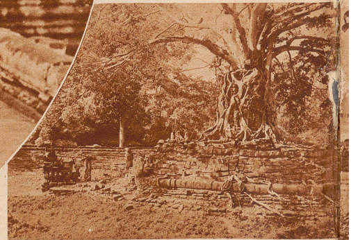
Der heilige, jetzt ausgetrocknete Badeteich, nach brahmanischem Muster erbaut. In der Mitte eine kleine Insel mit Bildnissen indischer Gottheiten, überwuchert von einem Urwaldbaum