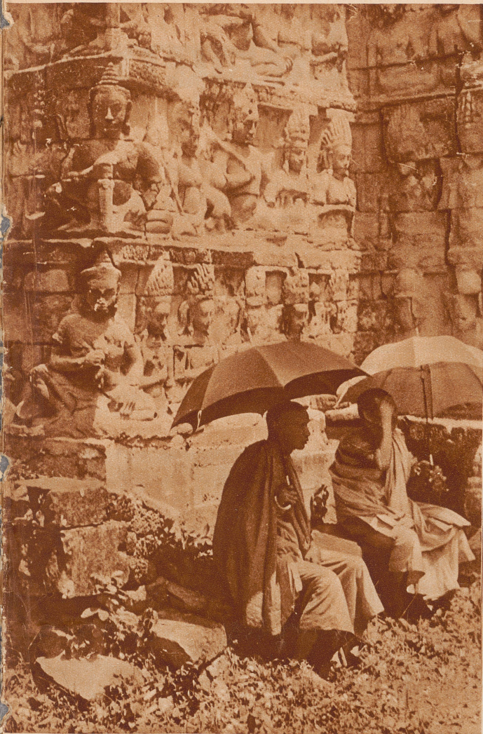
Angkor-Thom. Sehr gut erhaltene Bas-Reliefs an der einstigen Terrasse des Königs. Davor sitzen zwei buddhistische Priester