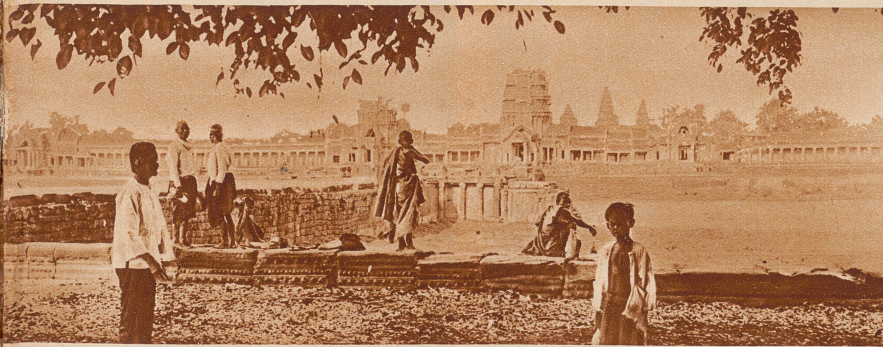
Gesamtansicht des Tempels von Angkor-Wat, vom Westufer des Kanals aus gesehen. In der Mitte der Haupteingang, die Königspforte

Nun sind die wichtigsten dieser Bauten dem Dschungel wieder entrissen worden. Mit großen Kosten hat die Regierung von Indochina die Restaurierung durchführen lassen, und zahllose Besucher aus aller Welt wandern nun jährlich durch die Paläste und Tempel, die vor tausend Jahren von Königen, Priestern und schönen Haremsdamen bewohnt waren.