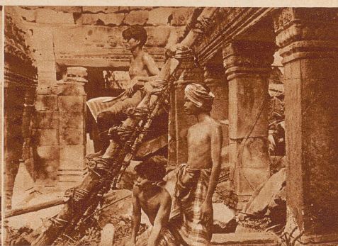
Mit großen Kosten hat die Regierung von Indochina die Restaurierung des Tempels von Angkor-Wat durchführen lassen. — Eingeborene bei den Restaurierungsarbeiten