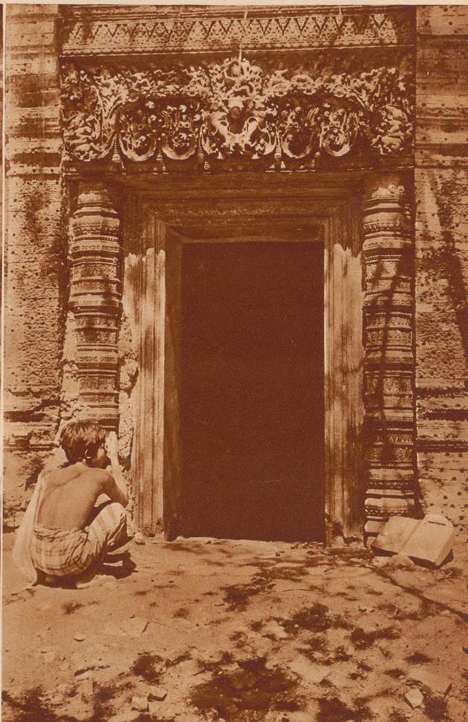
Reichverziertes Portal am einstigen Wassertempel Me-Bon, der im Jahr 950 erbaut worden sein soll

lern jahrzehntelang gearbeitet haben, denn jeder Stein, jede Säule, jede Wand ist mit kunstvoller Ornamentik oder mit Darstellungen aus den altindischen Sagen verziert. Die drei übereinanderliegenden Terrassen sind durch steile Treppen verbunden. Dem gewöhnlichen Volke war nur die Galerie, welche um die erste Treppe führt, zugänglich, Priester und Höflinge hatten Zutritt zur zweiten, der König allein begab sich auf die dritte, wo er vor dem Allerheiligsten seine Gebete sprach.