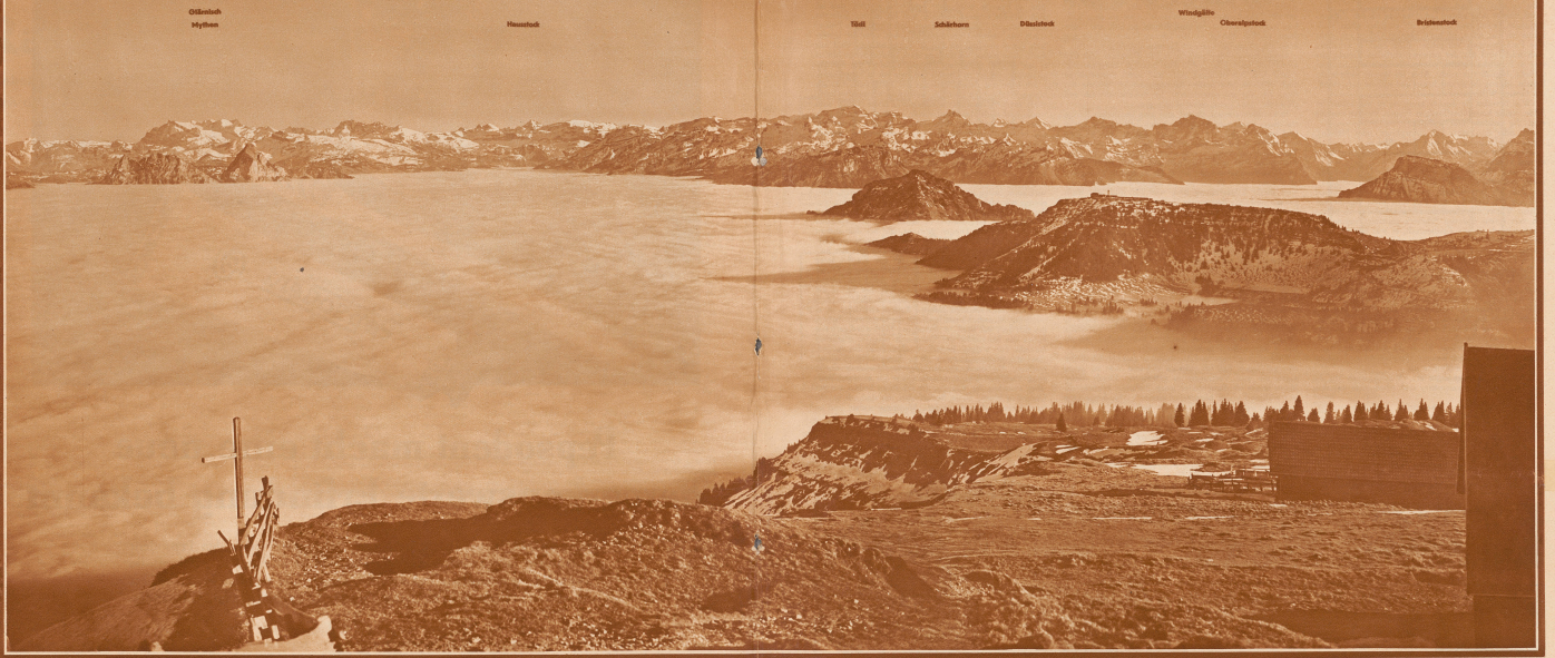
Der Nebelsee. Bild von Rigi-Kulm nach Südosten