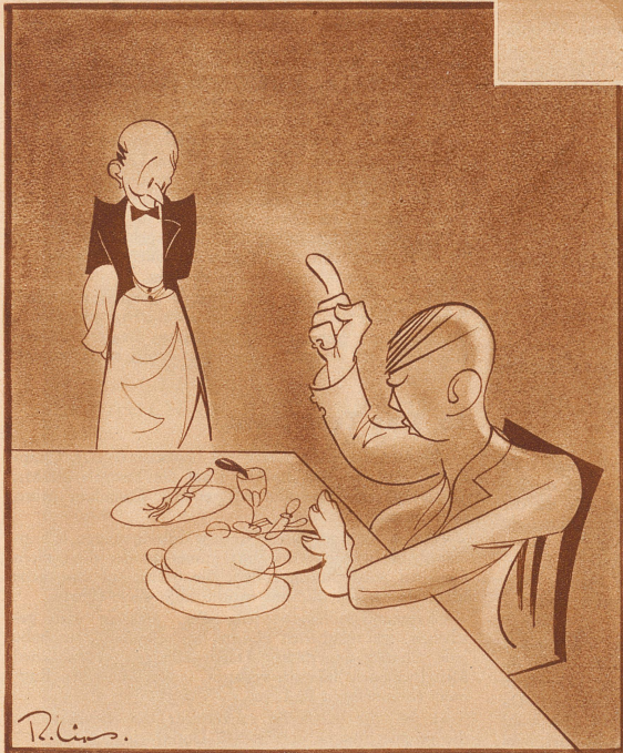
Restaurant: «Kellner, wenn Sie sich untersteben, mir morgen wieder solch ein Essen vorzusetzen, haben Sie mich heute das letztmal gesehen!»