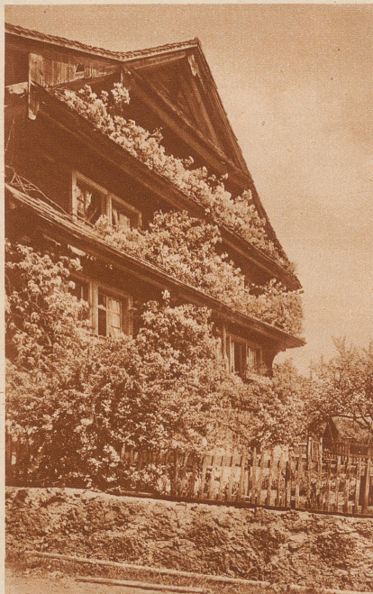
Nach dem Vierwaldstättersee zu finden wir das «Länderhaus», oft ganz verschindelt, das Dach ist noch steiler als in der Ostschweiz. Charakteristisch sind hier vor allem die kleinen Schutzdächer, die über den Fensterreihen hinlaufen