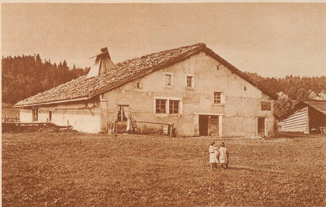
Ein altes Neuenburger Steinhaus romanischer (lateinischer) Bauart. Haus und Scheune befinden sich unter einem Dach. Der Stall liegt im Erdgeschoß etwas versenkt, unterhalb des Wohnraums. Auf dem Dach das vierkantige Kamin mit einer Rauchklappe