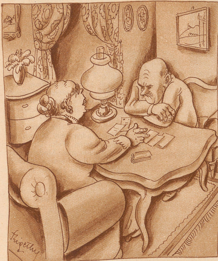
Bei der Hellscherin

«Herr Apotheker, ich möchte ein Bandwurmpulver haben.» «Für einen Erwachsenen?» «Ich weiß doch nicht, wie alt der Wurm ist.»