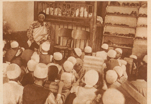
Gemeinsame Lese-Uebung. Alle zusammen lesen laut aus dem Koran; einige von den Älteren können die Verse auch schon auswendig. Rechts ist das Gestell, auf dem während der Schulzeit die Schuhe der Schüler stehen