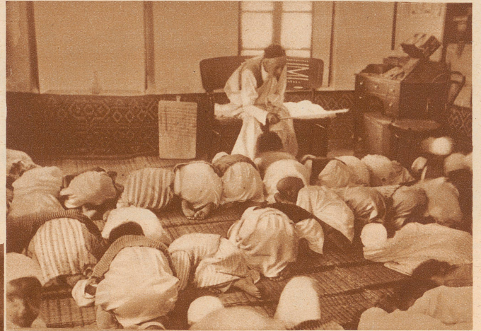
Das Gebet zu Beginn des Unterrichts. Alle knien nieder und neigen den Kopf vorne bis zur Erde. Ein kleiner brauner Kerl, der dritte rechts in der zweiten Reihe, dreht schnell einmal den Kopf, um dem Mann zuzuschauen, der ihn da fotografiert; das dürfte eigentlich nicht, denn die Gebetsstunde ist sehr streng. Mit dem Stock, den der alte Lehrer in der Hand hält, will er die Kinder nicht schlagen, sondern er benützt ihn wie einen Taktstock, um das gemurmelte Gebet zu dirigieren