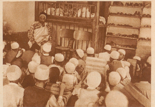
Gemeinsame Lese-Uebung. Alle zusammen lesen laut aus dem Koran; einige von den Älteren können die Verse auch schon auswendig. Rechts ist das Gestell, auf dem während der Schulzeit die Schuhe der Schüler stehen