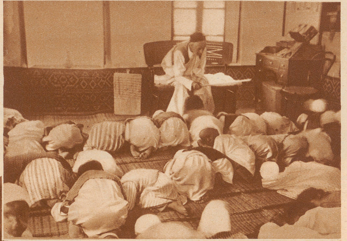
Das Gebet zu Beginn des Unterrichts. Alle knien nieder und neigen den Kopf vorne bis zur Erde. Ein kleiner brauner Kerl, der dritte rechts in der zweiten Reihe, dreht schnell einmal den Kopf, um dem Mann zuzuschauen, der ihn da fotografiert; das dürfte eigentlich nicht, denn die Gebetsstunde ist sehr streng. Mit dem Stock, den der alte Lehrer in der Hand hält, will er die Kinder nicht schlagen, sondern er benützt ihn wie einen Taktstock, um das gemurmelte Gebet zu dirigieren