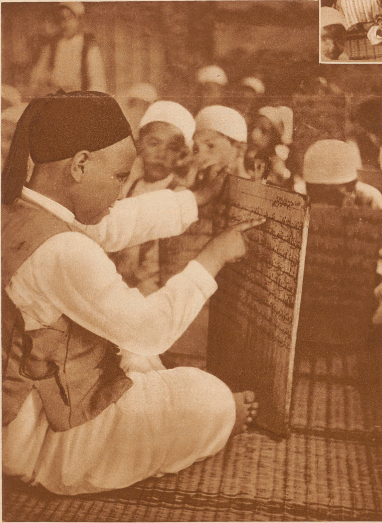
Der Unterricht. Ein älterer Schüler liest den kleineren Verse aus dem Koran vor, die auf einer großen Holztafel aufgemalt sind. Die merkwürdigen Schriftzeichen sind arabisch; es ist eine Schrift, die man von rechts nach links liest und schreibt