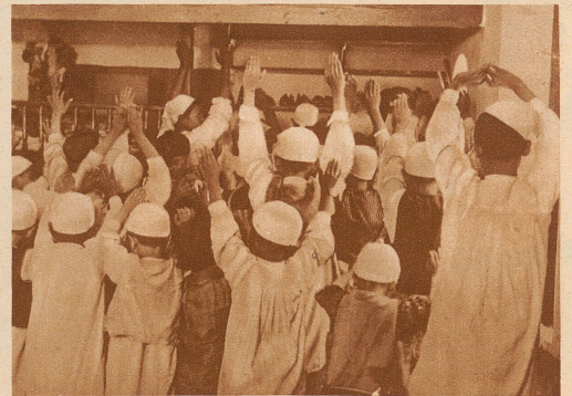
In der Moslem-Schule wird mit beiden Händen aufgestreckt!