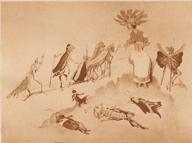
Frau Arnika pflegt die kranken Tiere (Aus «Bergblumen»)

Es gibt unter den heute Erwachsenen Unzähliche, deren Kindheitshimmel bevölkert war von den lieblichen und lustigen, den halb irdischen, halb zauberhaften Wesen der Kreidolfschen Welt. Dazumal wie heute leben die Kinder beglückt mit Frau Bohne und Frau Erbse, mit der schönen Frau Georgine und ihren Kindern, mit Herrn Schlüsselblum und Frau, mit den diebischen Nachtschattengewächsen und mit den geliebten Wiesenzwergen. Daß das keine gewöhnlichen vergänglichen Bilderbücher, sondern die Werke eines großen Künstlers sind, wußten die Kinder noch nicht. Die inzwischen Herangewachsenen aber wissen es und werden am 9. Februar dankbar des Siebzigjährigen gedenken.