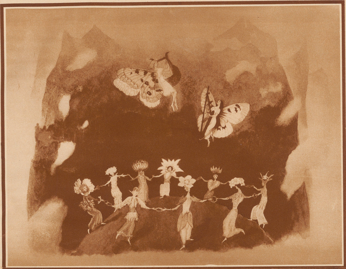
«Parnass» (Aus dem Werk «Bergblumen»)