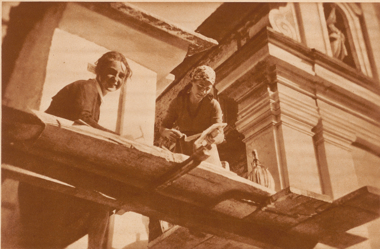
Die beiden jungen Frauen von Freskomaler Sturm und Bildhauer Oßwald helfen eifrig bei der Arbeit mit