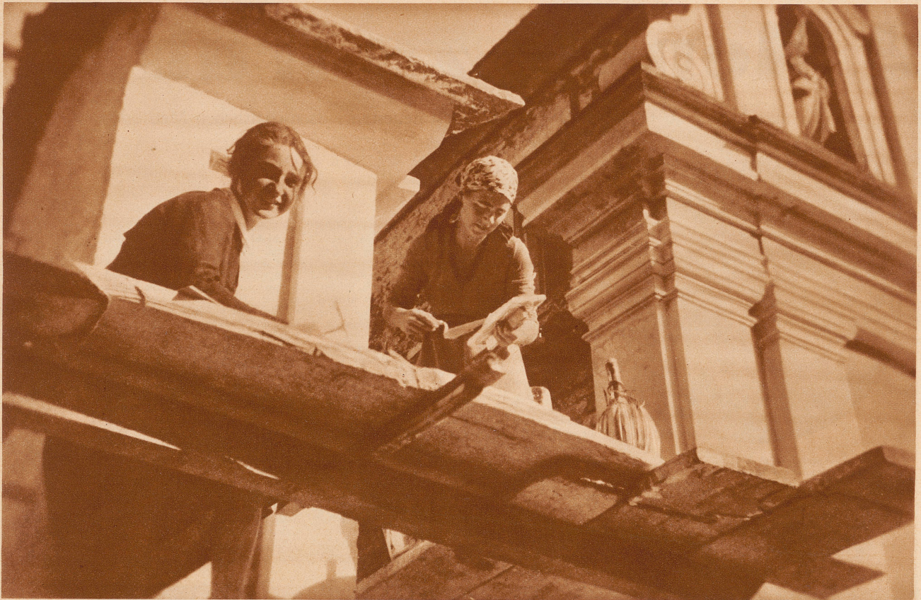
Die beiden jungen Frauen von Freskomaler Sturm und Bildhauer Oßwald helfen eifrig bei der Arbeit mit