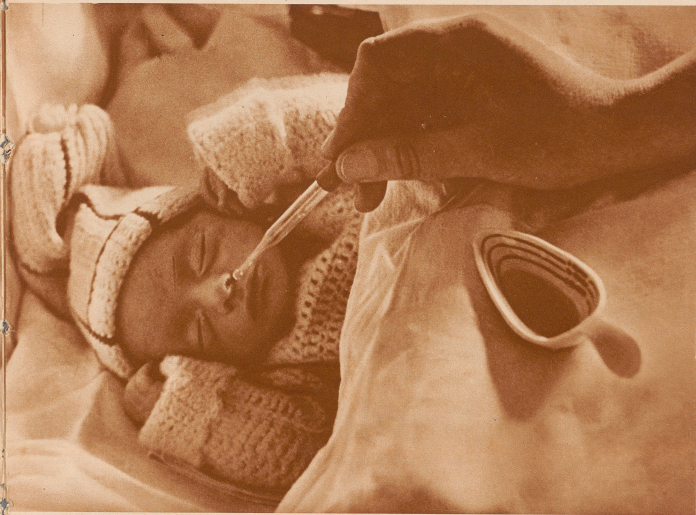
Schläfen ist für diese winzigen Wesen noch eine zu große Arbeit. In vielen kleinen Einzelkammern wird ihnen daher die Milch mit der Pipette maßgenau durch die Nase eingegeben.

so tritt als erste technische Einrichtung die «Kochkiste» in Erscheinung, das ist ein einfacher Kastenkorb mit zwei Handeln und einem kleinen Fensterchen im Deckel, aber mit doppelter Wärmeschutz-Einrichtung im Innern. Denn das oberste und wichtigste Gesetz der Babyaufzucht heißt Schutz vor Wärmeverlust.