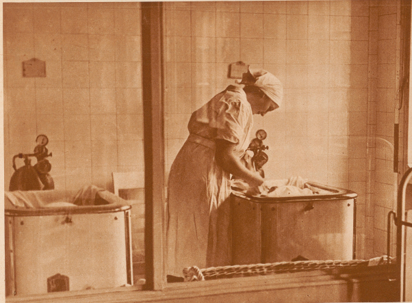
In der Kinderkammer während der ersten Monate legt die Stoppeln meistens seinen Rücken in der sogenannten «Rehröhre», die beide in einer Wanne mit doppelter Wänden, die ständig von warmem Wasser durchfließen werden. Auch die Atmungsorgane werden, für den Fall, daß Atmungsbeschwerden eintreten sollten, mit kleinerer Wasserdampf-Einrichtung angefaßt. Die ganze Kübeln-Anordnung ist in einem Raum untergebracht, der durch eine einzige dicke Glaswand hermetisch von der Außenwelt abgeschlossen ist. Außer den Stationswärtinnen und dem Chirurgen darf niemand den Raum betreten. Unsere Aufgabe würde von außen, durch die Glaswand hindurch, gemacht.

Wenn heute dem Krankenhaus eine vorzeitige Geburt gemeldet wird,