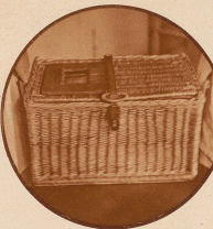
In der «Kochkiste» wird das zu früh Geborene im Krankenhaus geteilt, wo man ihm mit äußerster Vorsicht und allen zur Verfügung stehenden Mitteln über die ersten Wochen hinweghelfen wird. Die Kochkiste ist eigentlich ein Kleinkästchen mit einem kleinen Fensterchen im Deckel und guter Wärmeschutz-Einrichtung im Innern. In sie lag das kleine Monatskind, das in weiche Watte verpackt, seinen ersten Weg in diese Welt zurück.

Die ärztliche Kunst ist heute sehr weit entwickelt und darf sich mit Erfolg an Probleme heranwagen, in die sie früher nicht einmal hätte denken dürfen. Frühgeborene, solche besonders, die schon im sechsten oder gar sechsten Monat der Welt erblickt haben, mußten früher als verloren gelten; niemand durfte hoffen, daß solche armeneligen kleinen Wurmchen von zwei (oder noch weniger) Pfund Gewicht am Leben erhalten werden könnten. Man verzog sogar recht merkliche Aussichten. Unter Berufung auf China und andere Länder, in denen das Aussehen schwächlicher Kinder auch heute noch geübt wird, auch mit dem Hinweis auf das Griechenland des Altertums, stellte man die Frage: Lohnt es überhaupt, sich anzustrengen, um Frühgeborene zu erhalten? Ist ihre vorzeitige Geburt nicht schon ein deutlicher Hinweis der Natur, daß sie die Existenz dieses Schwächlings nicht wünscht?