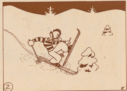
Doch herrjeh, — ein Bäumchen schneebedeckt. Hat da unsern Jonas böß erschreckt.