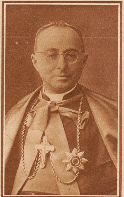
Monsignor Rodrigo Villeneuve

stammt aus dem böhmischen Erzgebirge und steht im 65. Altersjahr. Während des Krieges war er apostolischer Delegat in Konstantinopel. Seit 1923 ist er Titularbischof von Hierapolis und päpstlicher Nuntius in Bukarest, Er gilt als hervorragender Diplomat und Kenner des nähern Orients