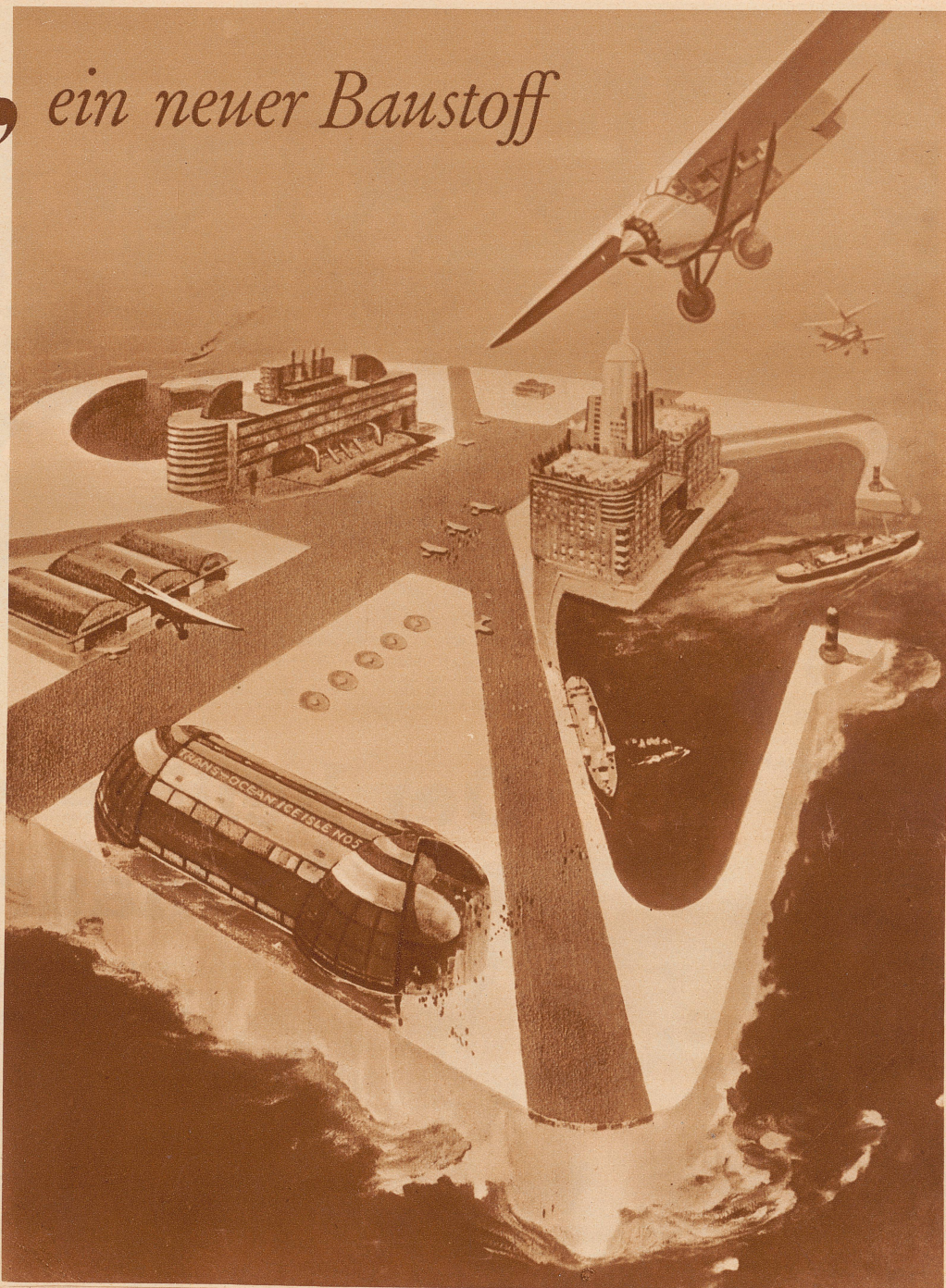
Schwimmende Insel aus Kunsteis im Meer, als Stützpunkt für den Transozeanflugverkehr