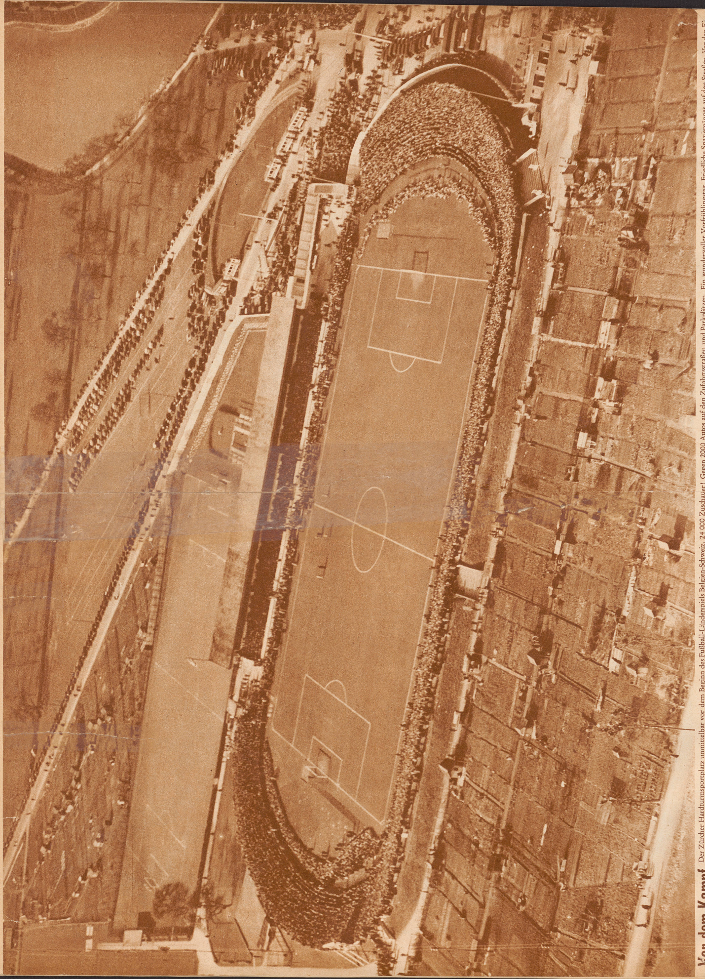
Vor dem Kampf Der Zürcher Hardturmsporplatz unmittelbar vor dem Beginn des Fußball-Länderspiels Belgien-Schweiz. 24 000 Zuschauer! Gegen 2000 Autos auf den Zufahrtsstraßen und Parkplätzen. Ein wandervoller Vorfrühlings- tag. Friedliche Spaziergänger auf den Straßen. Vor den Eingangstoren zum Stadion stauen sich die Pechvögel, die keinen Platz mehr bekommen. Am linken Rand zieht sich von unten nach oben eine Ueberland-Starkstromleitung durchs Bild. Im Vordergrund Scheerhäuschen und Gärten. Rechts oben die Linmat.