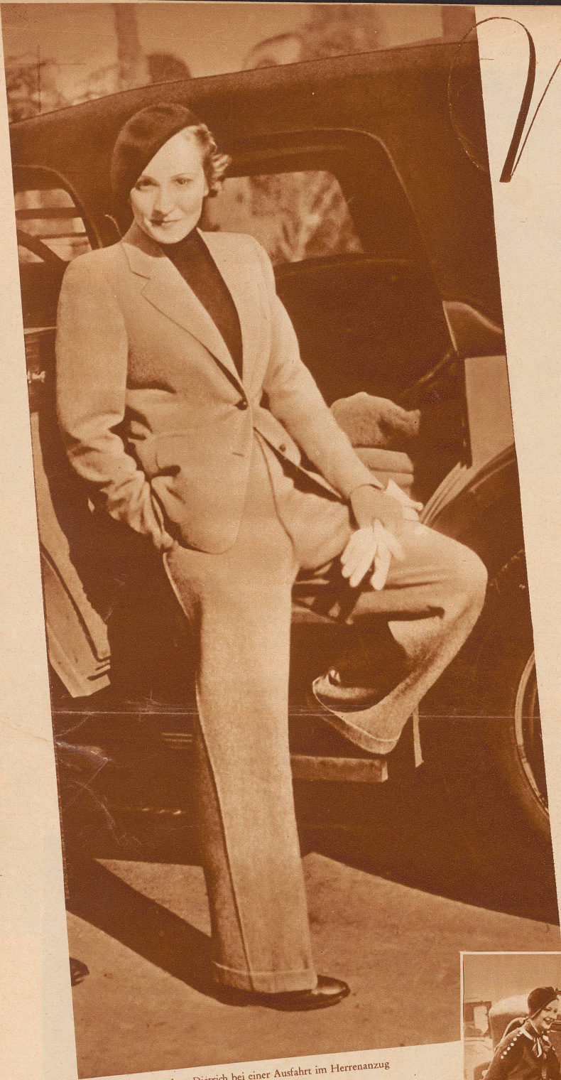
Marlene Dietrich bei einer Ausfahrt im Herrenanzug