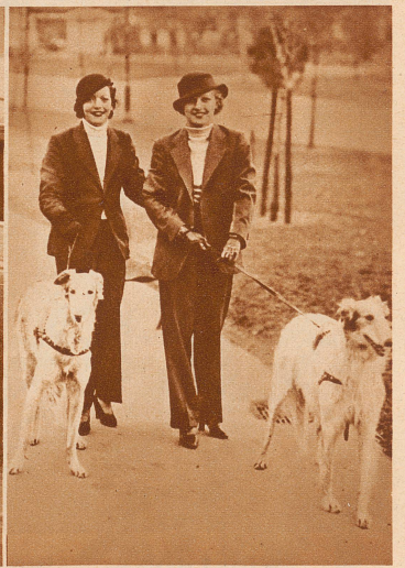
in New York