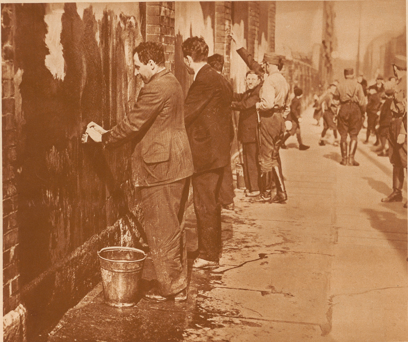
Die Arbeit an der Mauer

Ein Leser unserer Zeitung, der zur Zeit in Deutschland reist, schickt uns diese drei Bilder mit folgenden Erläuterungen: «Ich war vorgestern bei meinem zwoeltägigen Aufenthalt in Chemnitz Zeuge von diesem Vorkommnis: Straßenauflauf! Ein Zug Braunhemden! In der Mitte marschiert mit Eimer und Bürste ein Trupp Leute, unverkennbar polnische Juden oder Polacken, wenn man so sagen darf. Halt an einer Mauer, an der noch Ueberreste der Wahlpropaganda-Anschläge klebten. Die Verhafteten füllten nun die Eimer mit Wasser und mußten die Mauer vor den Augen einer großen Zuschauermenge abwaschen und abkratzen. Hernach Rücktransport in die Haft. Zufällig konnte ein in der Nähe wohnender Photograph herbeigeholt werden, um die Angelegenheit zu knipsen.»