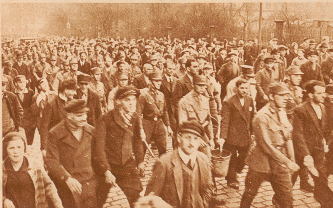
Der Marsch durch die Straßen