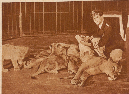
Gori mit ihren Jungen

Für mich gab es damals angesichts des gequälten Tieres nur einen Entschluß, in den Käfig zu treten und Gori beizustehen. Zum Schrecken meiner Wärter und des herbeigeeilten Personals trat ich zu der rasenden Gori. Ich ließ