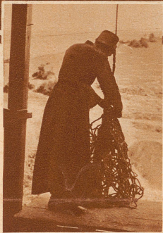
Meteora-Mönch läßt das Netz herab, worin die Besucher ins Kloster hochgewunden werden