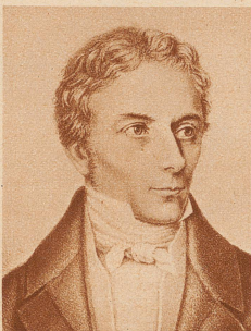
Der erste Rektor Laurenz Oken (1779—1851)

Er war der wichtigste Förderer des Neubaus, Präsident der vorbereitenden Kommission, Initiator in vielen Gestaltungsfragen, unermüdlicher Propagandist, überzeugter und überzeugender Redner vor dem Volke zu Gunsten der Hochschulvorlage, alles in allem: der besorgte und sorgende Vater des Universitätsneubaus