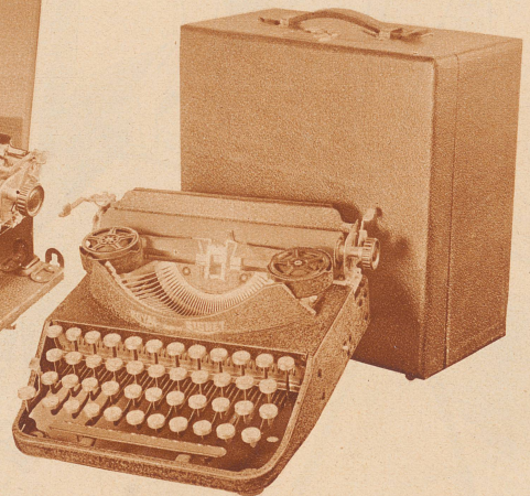
Royal Portable Signet , vereinfachtes Modell, mit Universal-Klavatur inkl. Reise-Koffer . . Fr. 275.-

So kann sich jeder Interessent das für seine Zwecke am geeignetsten erscheinende Modell auswählen. Prospekte und Vorführung kostenlos durch: