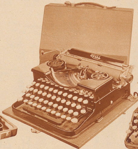
Royal Portable mit sämtlichen Neuerungen ohne Tabulator, Modell 1931, komplett mit Reise-Koffer . Fr. 350.-