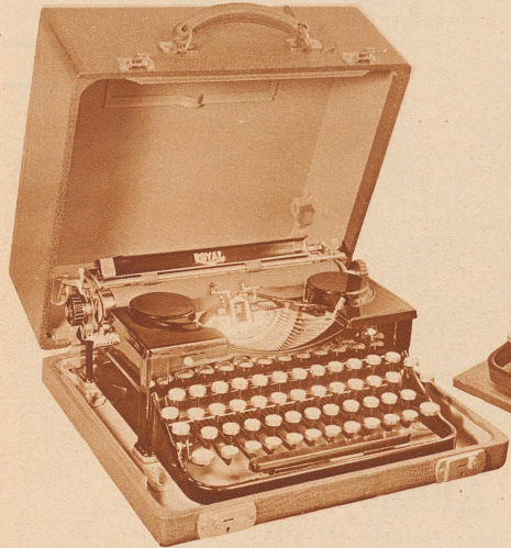
Royal Portable mit sämtlichen Neuerungen, Tabulator, Sparschaltung etc. komplett mit Reise-Koffer . Fr. 450.-

die bekannte Weltmarke, liefert folgende drei Portable Schreibmaschinen je nach Bedarf und Wunsch des Kunden: