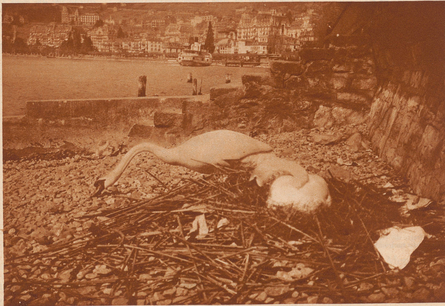
Brütende Schwäne am Genfersee

Und dann schrie er fast auf vor Grauen: seine eigene Stimme hatte der Stimme geglichen, die er suchte: der Stimme des Mörders.