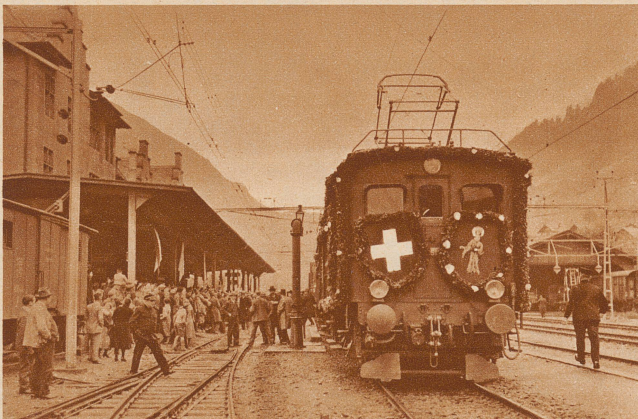
Ziegelbrücke-Glarus-Linthal elektrisch. Am 12. Mai wurde die SBB-Linie durch das Glarnerland im Beisein von Vertretern der Bahn- und Kantonsbehörden feierlich eingeweiht. – Die bekränzte Lokomotive des ersten elektrisch betriebenen Zuges auf der Station Glarus

die bekannte Neuenburger Volkschriftstellerin und Journalistin, starb 76 Jahre alt