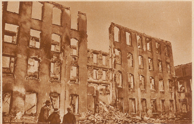
Großfeuer in Schwanden. In der Nacht vom 12. zum 13. Mai ist der größte Teil der ehemaligen Druckfabrik Wyden zwischen Schwanden und Nidfurn, die jetzt in eine Zwirnerei umgebaut, aber noch nicht im Betrieb genommen worden war, von einer Feuersbrunst zerstört worden. – Das total ausgebrannte Hauptgebäude