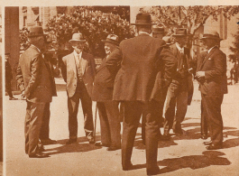
Die eidgenössischen Geschworenen bei der Vernehmung zum Augenschein