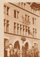
Die Sally Contrat in Gent, in welcher die Gerichtsverhandlungen stattfinden

Aufnahmen vom ersten Tag des Prozesses gegen Nicole und Mitangeklagte in Gent