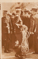
Zum Augenschein an den Ombelketter des Linthes vom 9. November 1912 rückt die Gentler Stadtpolizei mit Seilen für den Absperrenplan auf