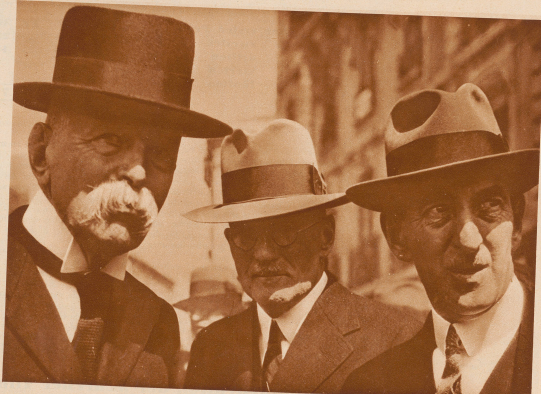
Die Mitglieder des eidgenössischen Kriminalgerichtsrates. Von links nach rechts: der 77-jährige Präsident Bundesratheer Schulz, Bundesrichter Kirchhofer und Bundesrichter Kues