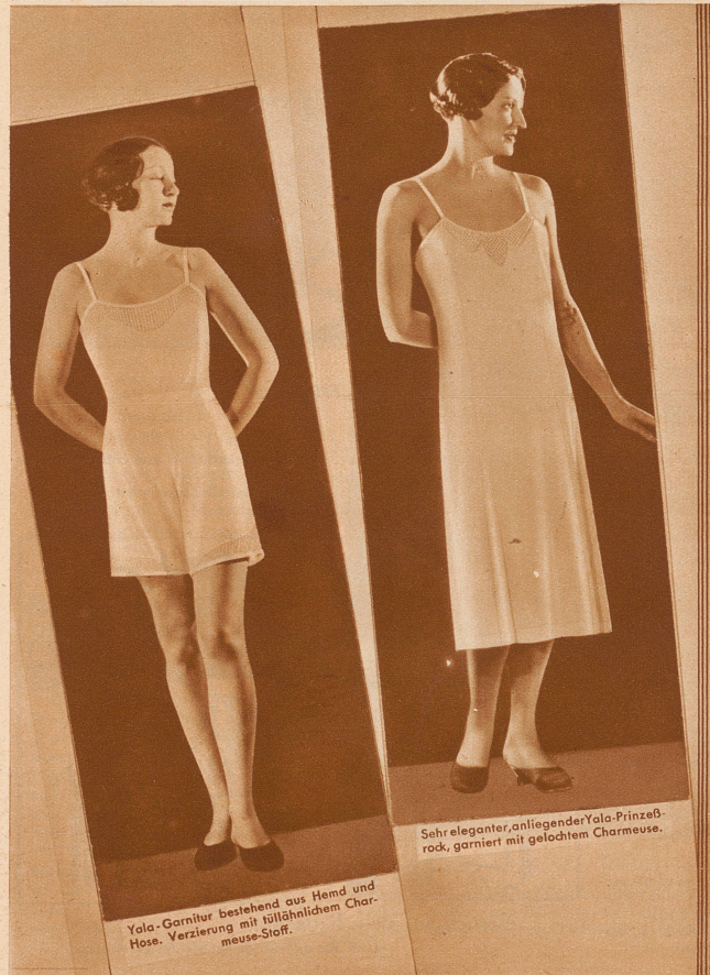
Yala-Garnitur bestehend aus Hemd und Hose. Verzierung mit tüllähnlichem Charmeuse-Stoff.