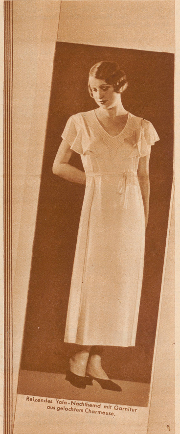
Reizendes Yala-Nachthemd mit Garnitur aus gelochtem Charmeuse.

Yala TRICOTWÄSCHE Der Inbegriff der Qualität!