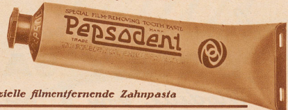
Die spezielle filmentfernende Zahnpasta