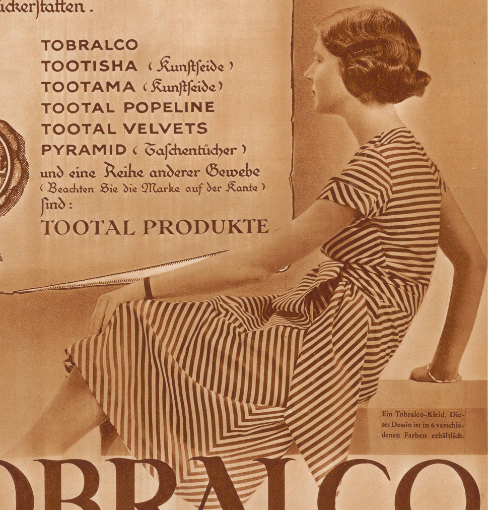
Ein Tobralco-Kleid. Dieses Dessin ist in 6 verschiedenen Farben erhältlich.

TOBRALCO TOOTISHA (Kunstseide) TOOTAMA (Kunstseide) TOOTAL POPELINE TOOTAL VELVETS PYRAMID (Taschentücher) und eine Reihe anderer Gewebe (Beachten Sie die Marke auf der Kante) sind: TOOTAL PRODUKTE