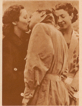
Der Abschiedskuß: Auf Wiedersehen James. Komm gut hinüber! Die Fliegerin Amy Johnson-Mollison verabschiedet sich von ihrem Mann J. A. Mollison vor dessen Start zum Transozeanflug