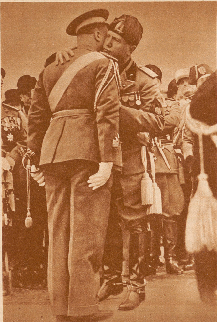
Der kameradschaftliche Kuß. Man kann ihn bei unsern südlichen Nachbarn oft sehen. Hier umarmt der Duce einen um die Luftfahrt verdienten hohen Offizier