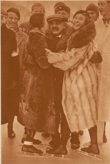
Freudenküsse. Der Weltrekord im Eislaufen über 500 m ist gebrochen! Ort: Davos im Winter 1933