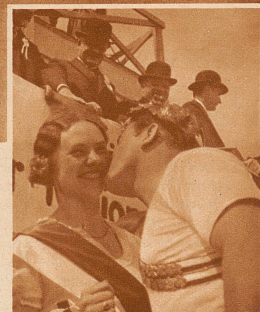
Der Turnerkuß. — Eine von den wenigen schweizerischen Gelegenheiten, die den offiziellen Kuß erlauben oder fordern. Aufnahme vom Eidgenössischen Turnfest in Aarau

es oder wie versöhnlich-erfreulich, wenn zum Beispiel bei der Ablösung jedesmal der ausscheidende Tramkondukteur seinem Nachfolger einen Kuß gäbe! Oder der Steuerbeamte dem Steuerzahler! Das ist ein Mittel, das Leben im Schweizerlande zu erheitern oder aufzuheitern, und wir bitten unsere Leser, sich beim Beschauen unserer wenigen aus den internationalen Kußreichtümern ausgewählten Bildern diese Erneuerung des nationalen Lebens doch einmal gründlich zu überlegen.