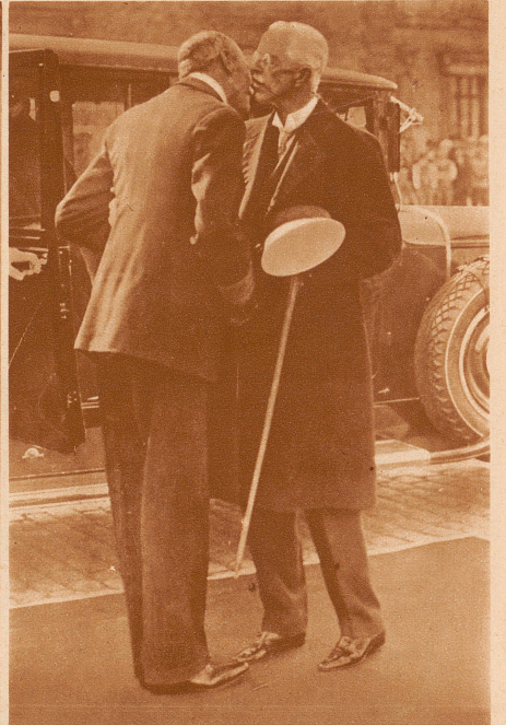
Der Kuß unter Königen. Der König von Schweden (rechts) stattet seinem Vetter, dem König von Dänemark (links) in Kopenhagen einen Besuch ab