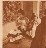
Graxilla ist kein Kind mehr, aber auch sie teilt sich ein Buch zur Unterhaltung aus, wenn sie mit ihrem Schwestern und einer Handarbeit in den Park von Retiro kommt