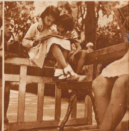
Das muß ja etwas ganz Spannendes sein