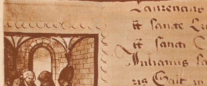
Ein seltenes Dokument aus dem Zürcher Staatsarchiv: Die Initial-Miniatur eines Ablassbriefes.

Sechzehn römische Kardinäle erteilen der Liebfrauenkapelle im Pflasterbach bei Regensburg Ablass. Die schönen Miniaturen in kunstvoller Zeichnung und leuchtenden Farben dürften von einem süddeutschen Maler stammen