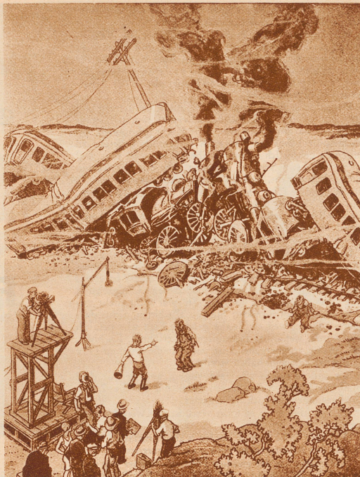
Der Filmregisseur: «Scheußlich, miserabel, ganz unbrauchbar! Sofort die ganze Geschichte noch einmal!»

Frage. «Ein Erdbeben hat die Stadt Pskowkreczoksm zerstört.» — «Hiieß sie vor dem Erdbeben auch schon so?»