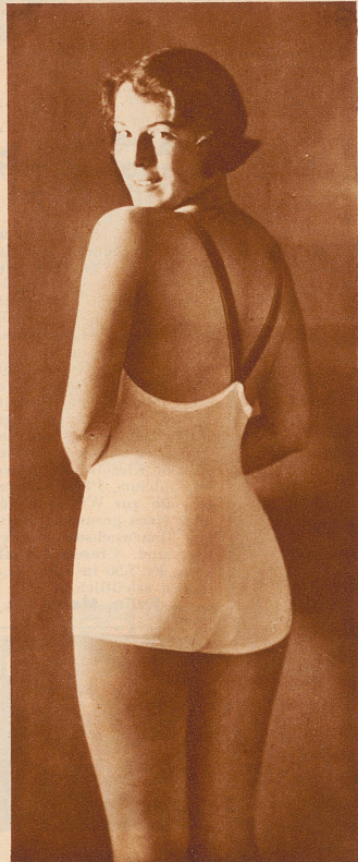
Neuheit: Modell XVII mit farbigen Trägern von Fr. 7.30 ab.