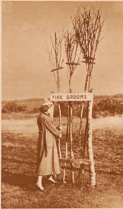
Mit dem Besen gegen das Feuer.

Sie stiegen langsam den Berg hinan. Unten schmiegte sich der See ins Land. In weichen Linien umschlossen ihn die blauen Berge. Hie und da blieb Richard stehen, um in verliebt Versunkensein die jugendliche Gestalt Katherines zu umfassen.