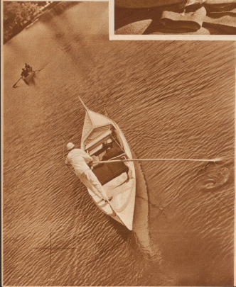
Bunte venezianische Gondeln beibehalten in Duranich die schönen Teiche des Palermo-Parks