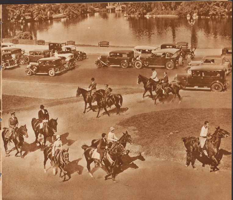
Ein grandioser Auskorsow wagt am Sonntag Vormittag über prächtige Autostrecken des Parks und Händler von eleganten Reitern und Reiterinnen tummelt sich auf den prächtigen Reitwegen