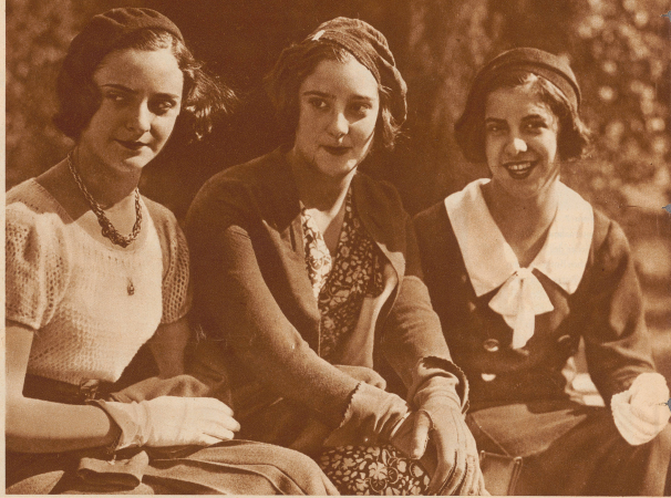
Drei junge Argentinierinnen im Palermo-Park von Buenos-Aires