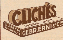
ZÜRICH Königsplatz GEBR. ERNI & Co

Ferromanganin EIN KRAFTSPENDER FÜR SIE UND IHN