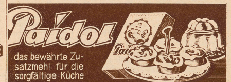
das bewährte Zusatzmehl für die sorgfältige Küche