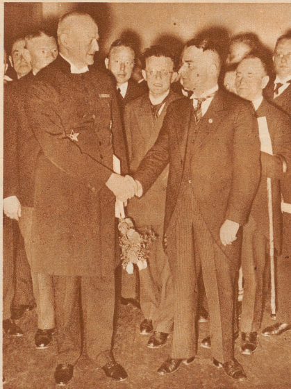
Wehrkreispfarrer Ludwig Müller (links) 50jährig. Nach dem Rücktritt von Reichsbischof Bodelschwingh gilt er als der kommende Mann in der gleichgeschalteten Kirche