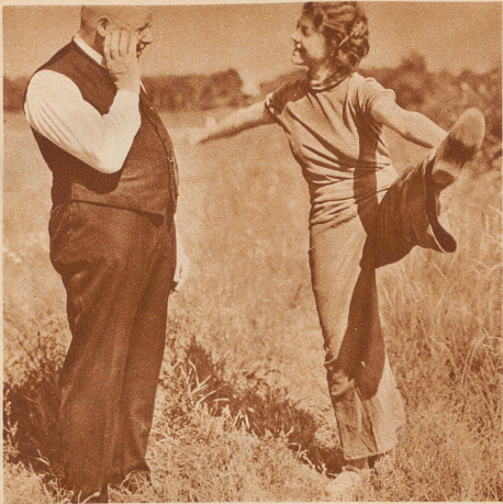
Lieber Himmel! Mädle! Das auch noch! Damit fangen wir aber lieber erst im nächsten Jahr an!

Dieser deutsche Papa mit seiner sportlichen Tochter – er hat's nicht leicht, er dachte, sich's in den Ferien recht bequem zu machen und im Grünen zu liegen. Statt dessen muß er jetzt im Grünen – – – turnen! Sonst bleibt sie nicht bei ihm – hat sie gesagt! Turnen; weil es zu