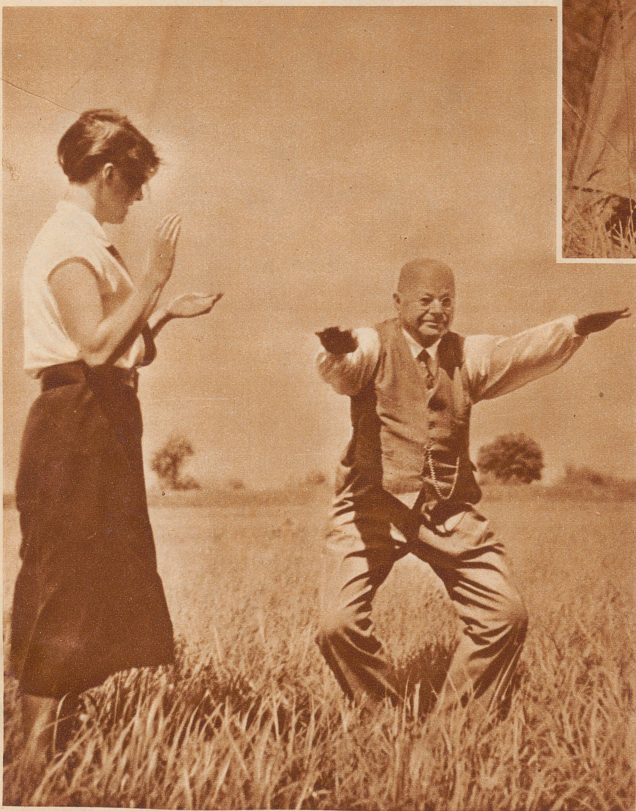
Kniebeugen – beugt! Eins-zwei-drei! – Hoch – Eins-zwei-drei! Langsam! Gut ausatmen. – Morgen geht's schon besser

seinem Besten ist, turnen gegen Arterienverkalkung, Rheumatismus, Fettansatz usw. Oh, diese modernen Töchter! Diese guten, forschen, kecken, lieben Geschöpfe! Schweizer-Väter, paßt auf, wenn ihr mit den Eurigen in die Ferien geht, denn die sportliche weibliche Jugend – sie ist ja auch bei uns ins Kraut geschossen – Gottlob!