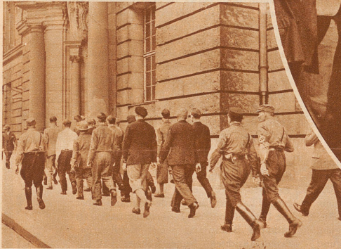
Die Deutschnationalen Kampfstaffeln aufgelöst und verboten. 30 Angehörige der Deutschnationalen Kampfstaffeln werden verhaftet und abgeführt, nachdem die Räume des Kampfzuges im Parteihaus in Berlin von den S. S. besetzt worden sind

Im Kreis: Staatsratspräsident Dr. Ley wird nach seiner Rückkehr aus Genf, wo er als Chef der deutschen Delegation an der Arbeitskonferenz teilnahm, in Berlin empfangen. Dr. Ley, einer der mächtigsten Männer an der Spitze des Dritten Reiches, ist Führer der deutschen Arbeitsfront. Die Aufgabe der deutschen Arbeitsfront besteht in der Wahrnehmung und Verteidigung der Interessen der deutschen Arbeiter- und Angestelltenverbände