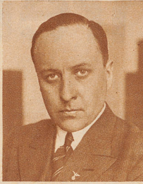
Dr. Walter Darré, der neue Reichsminister für Ernährung und Landwirtschaft, der Nachfolger Geheimrat Hugenburgs, ist der Vertrauensmann der deutschen Bauernschaft und gilt als energischer Gegner des Großgrundbesitzes

Im Kreis: Staatsratspräsident Dr. Ley wird nach seiner Rückkehr aus Genf, wo er als Chef der deutschen Delegation an der Arbeitskonferenz teilnahm, in Berlin empfangen. Dr. Ley, einer der mächtigsten Männer an der Spitze des Dritten Reiches, ist Führer der deutschen Arbeitsfront. Die Aufgabe der deutschen Arbeitsfront besteht in der Wahrnehmung und Verteidigung der Interessen der deutschen Arbeiter- und Angestelltenverbände