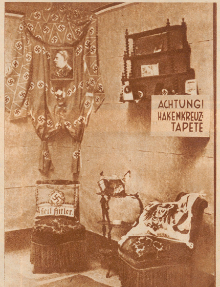
Kampf dem nationalen Kitsch. Unter dem Stichwort «Weg mit dem nationalen Kitsch» veranstaltete der Kampfbund für deutsche Kultur vom 16.-30. Juni in Köln eine Ausstellung. Die Schau hatte den Zweck, die Regierung in ihrem Kampfe gegen den Mißbrauch der nationalen Symbole zu unterstützen. Unser Bild zeigt eine Sammlung typischer verkitschter Gegenstände, denen nun der Kampf angesagt ist