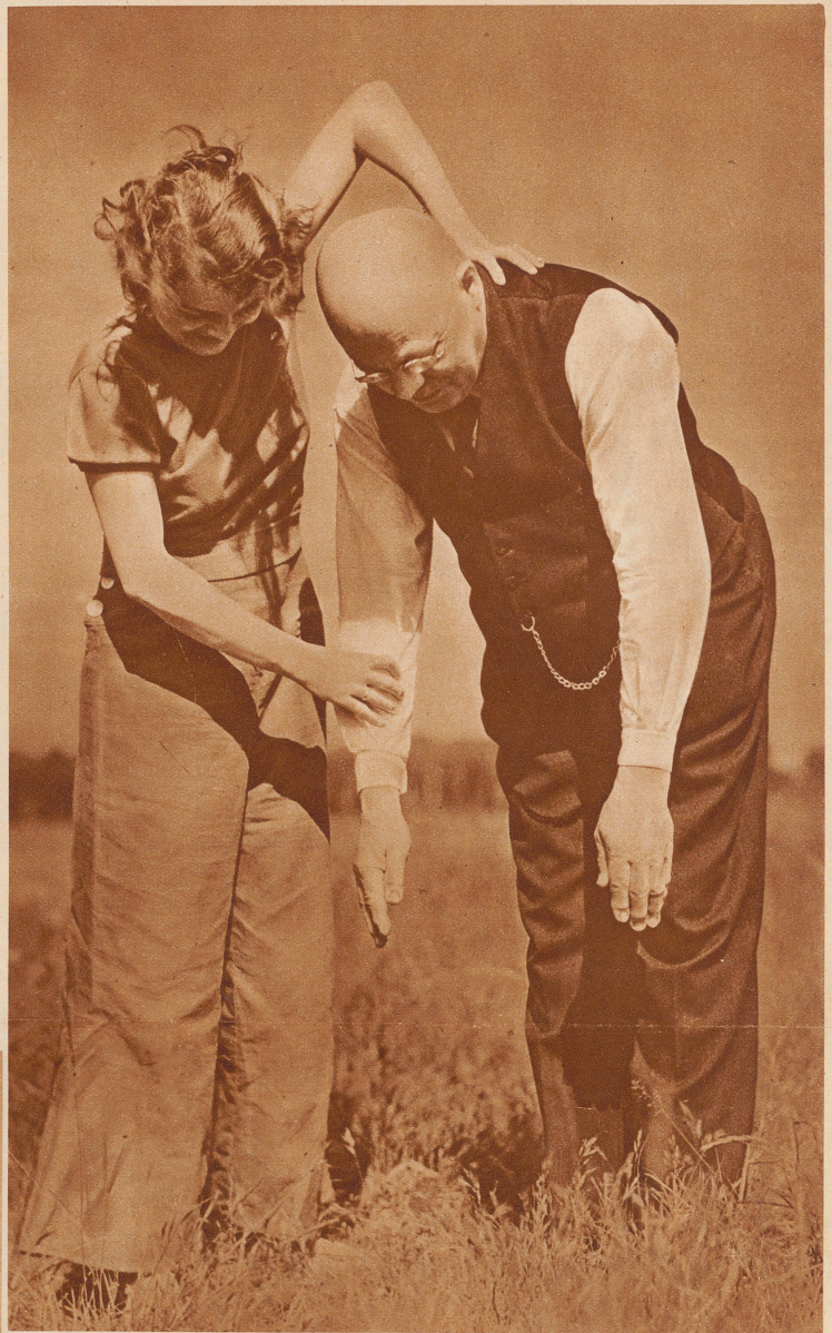
Locker, locker, Vati! Und dann runter bis auf die Fußspitzen mit den Händen! Rückenweh? Ach, nein, das ist nur der böse Anfang

Dieser deutsche Papa mit seiner sportlichen Tochter – er hat's nicht leicht, er dachte, sich's in den Ferien recht bequem zu machen und im Grünen zu liegen. Statt dessen muß er jetzt im Grünen – – – turnen! Sonst bleibt sie nicht bei ihm – hat sie gesagt! Turnen; weil es zu