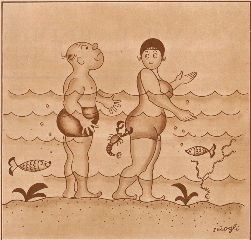
Kleiner Irrtum im Strandbad

«So, Sie sind Mediziner», sagt die Tänzerin zu ihrem Partner auf dem Studentenball, «also Zugführer auf der Bahn in den Himmel.» «Nein», meint der Student, «bloß Bremser!»