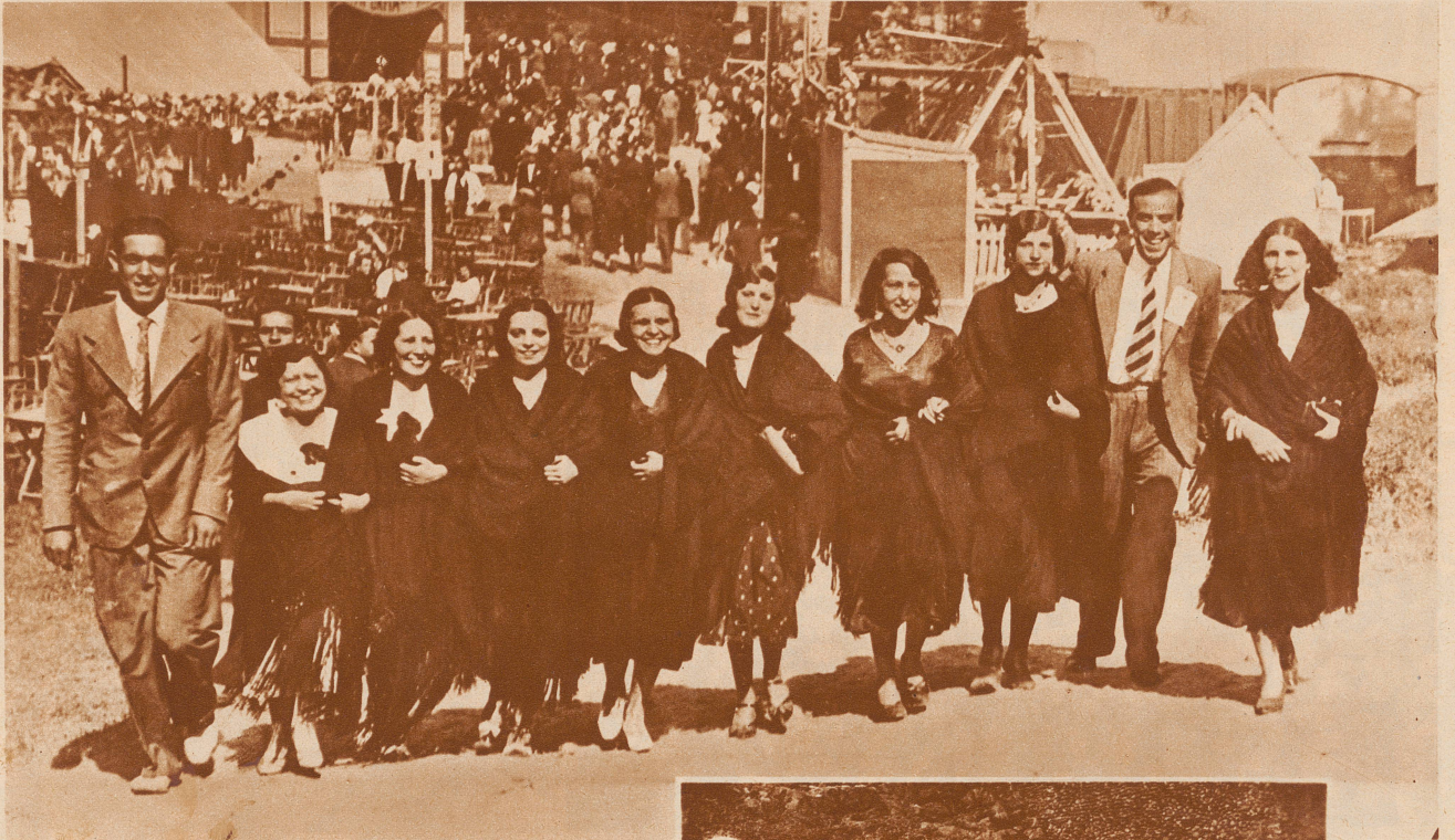
Sie bitten den Herrgott um einen Liebsten. Eines der ältesten religiösen Feste Spaniens ist der Tag des Heiligen Antonius am 14. Juni. An diesem Tag haben nach uralter Gepflogenheit jene Mädchen, die noch ungeliebt sind, das Recht, geschlossen in die Kirche zu gehen und Gott um einen Liebsten zu bitten. — Bild: Eine Gruppe junger «Madrilenas» in der landesüblichen schwarzen Mantilla auf dem Kirchgang am St. Antonstag