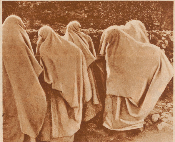
Wenn ein Fremder kommt, — wenden sie sich ab: Frauen in der Wüstenstadt El Oquad in Algerien