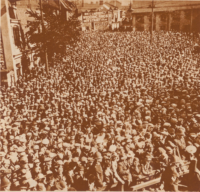
Alle sind gekommen, um die Tennisheldin zu feiern