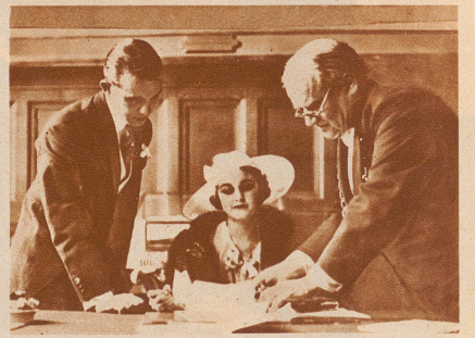
Die Reichste. Miss Barbara Hutton, die Erbin des riesigen Woolworth-Vermögens und damit die reichste Erbin der Welt, hat sich in Paris mit dem georgischen Prinzen Mdivani, dem frühesten Gatten der Pola Negri, verheiratet. Vor der Verheiratung mußte der Bräutigam eine Verzichtsurkunde auf die Millionen seiner zukünftigen Frau unterzeichnen. — Bild: Barbara Hutton bei der Unterzeichnung des Ehekontrakts im Standesamt in Paris