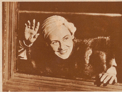
Charlie Chaplins dritte Frau: Paulette Goddard, eine sehr junge Dame aus der besten New-Yorker Gesellschaft, die künftig auch die Film-Partnerin ihres berühmten Gatten sein wird. Die Hochzeit fand ganz im Geheimen auf hoher See statt