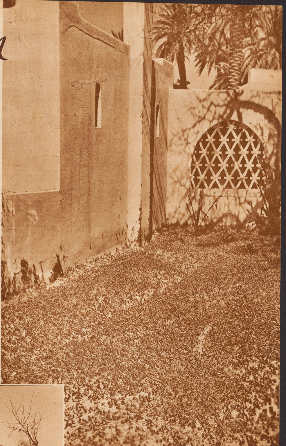
Der Hof des Transatlantique Hotels in Laghouat nach dem Heuschreckenüberfall